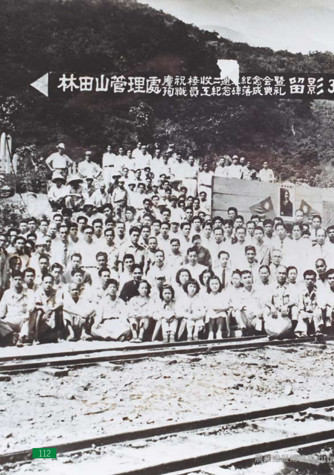
林田山管理處慶祝接收二週年紀念會暨殉職員工紀念碑落成典禮留影